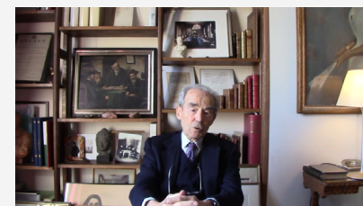
À l'occasion de la journée internationale dédiée à la mémoire des victimes de l'Holocauste, Monsieur Robert BADINTER, ancien Président du Conseil constitutionnel, ancien Garde des Sceaux et ancien Sénateur, livre à l'AFNU ses pistes de réflexion.

Le 27 janvier marque l'anniversaire de la libération en 1945 du Camp de concentration et d'extermination allemand nazi d'Auschwitz-Birkenau par les troupes soviétiques. Cette date a été appelée Journée internationale dédiée à la mémoire des victimes de l'Holocauste par l'Assemblée générale des Nations Unies. Il est essentiel de connaître l'histoire de l'Holocauste pour mieux comprendre les causes qui entraînent les sociétés dans le génocide et sensibiliser à la nécessité de consolider la paix et les droits de l'homme pour prévenir d'autres violences de masse. Nous devons prendre conscience que le génocide n'est pas inévitable, que les états et les citoyens ont des responsabilités, que le silence contribue à l'oppression et que les préjugés et le racisme ont des racines.