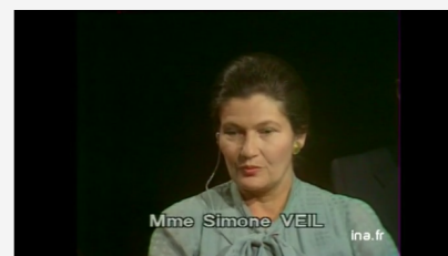
Simone VEIL s'exprime sur la nécessité de montrer le mécanisme de l'holocauste et la mise en place par le régime nazi de l'extermination de masse : la déshumanisation des déportés dans les camps.